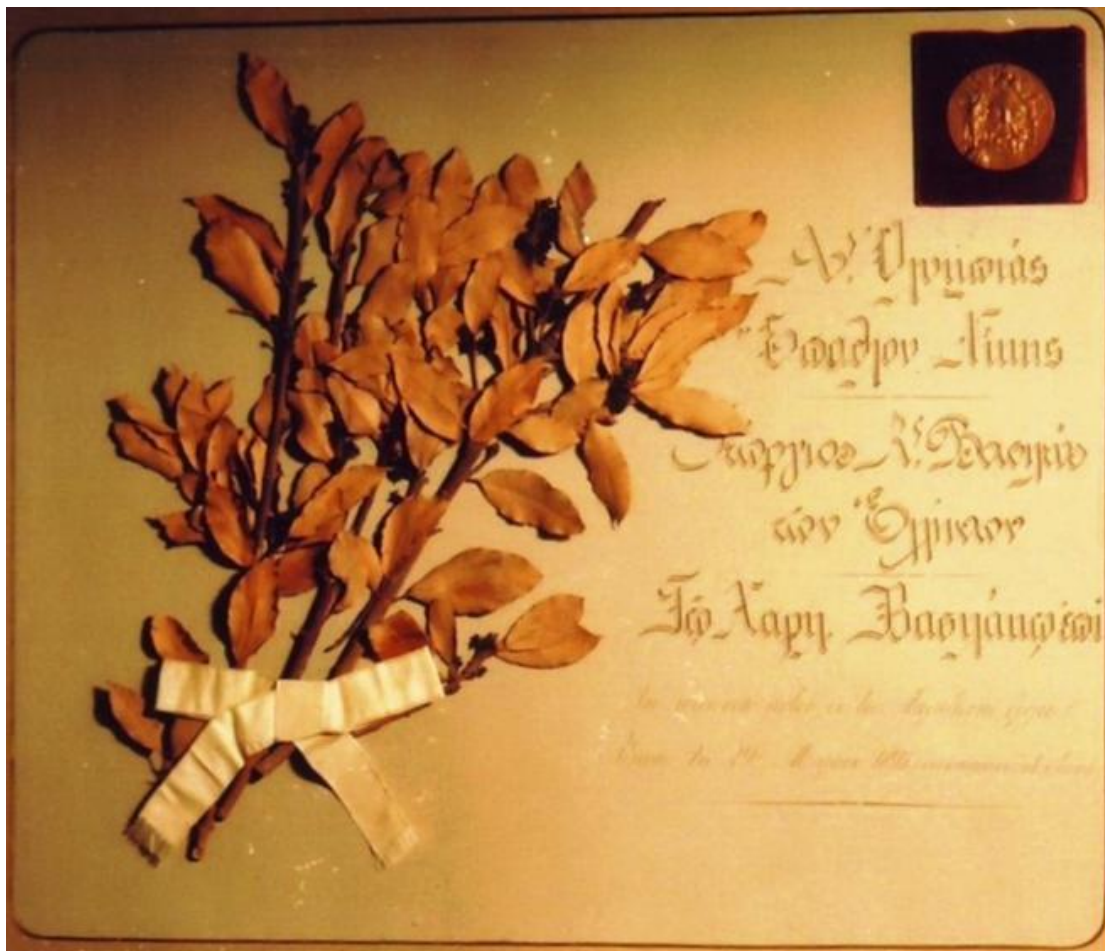
Το Ολυμπιακό Μετάλλιο 2 ης νίκης Μαραθωνίου Δρόμου, το τιμητικό δίπλωμα και το μοναδικό δάφνινο στεφάνι που έχει σωθεί από το 1896 εκτίθενται στο Μουσείο Νεότερων Ολυμπιακών Αγώνων στην Αρχαία Ολυμπία .

1900: Εισάγει το αγώνισμα Βάδην στην Ελλάδα