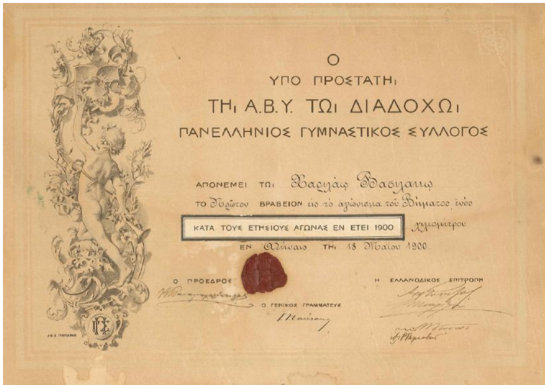
Το τιμητικό δίπλωμα πρώτης νίκης στον πρώτο αγώνα Βάδην στην Ελλάδα – 18 Μαΐου 1900 Εκτίθεται στο Μουσείο Μαραθωνίου Δρόμου στον Μαραθώνα .

Στη συνέχεια, ως αθλητής συμμετείχε με επιτυχίες σε πολλούς αγώνες δρόμου.