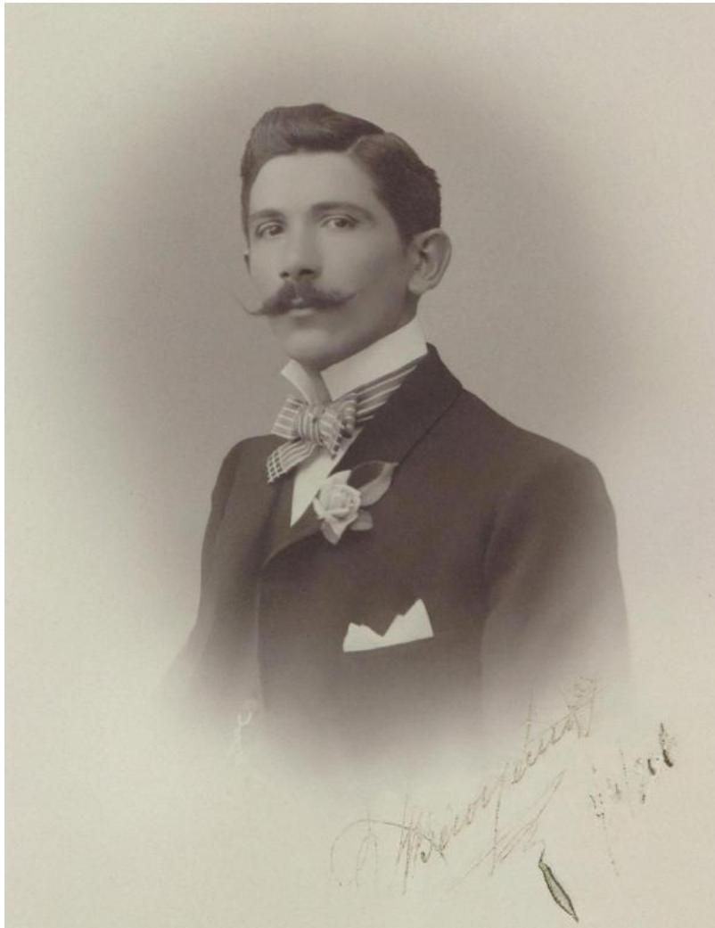
Ο Χαρίλαος Βασιλάκος

Η πολιτική και αθλητική ηγεσία της χώρας τον τίμησαν πολλές φορές για την αθλητική του προσφορά στην Ελλάδα, με διάφορες εκδηλώσεις και μετάλλια μέχρι τον θάνατό του στον Πειραιά το 1964.